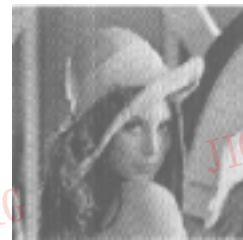
图 1 Lena 原图

对加噪后的 Lena 图象进行边缘检测实验.图 1 为加噪前的原始图象.图 2(a)~图 2(d)分别为原图加入噪声方差 \sigma 分别为 5、10、15、20 的零均高斯白噪声后得到的图象.图 3 分别为对图 2 进行边缘检测的结果.