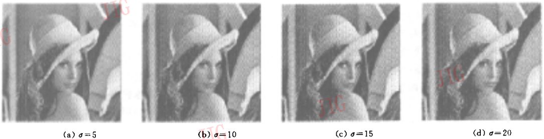
图 2 加噪后的 Lena 图象