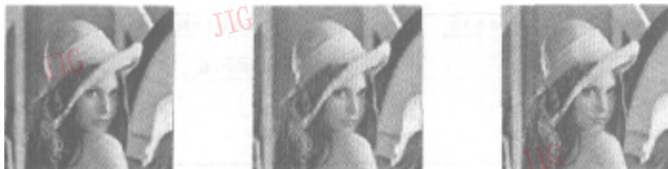
(a) 基于边缘检测的小波阈值去噪方法 (采用 VisuShrink 阈值) (b) 普通的小波阈值去噪方法 (采用 VisuShrink 阈值) (c) 普通的小波阈值去噪方法 (采用经过调整的 VisuShrink 阈值)