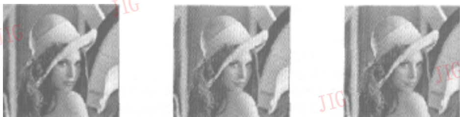
(a) 基于边缘检测的小波阈值去噪方法 (采用 VisuShrink 阈值) (b) 普通的小波阈值去噪方法 (采用 VisuShrink 阈值) (c) 普通的小波阈值去噪方法 (采用经过调整的 VisuShrink 阈值)