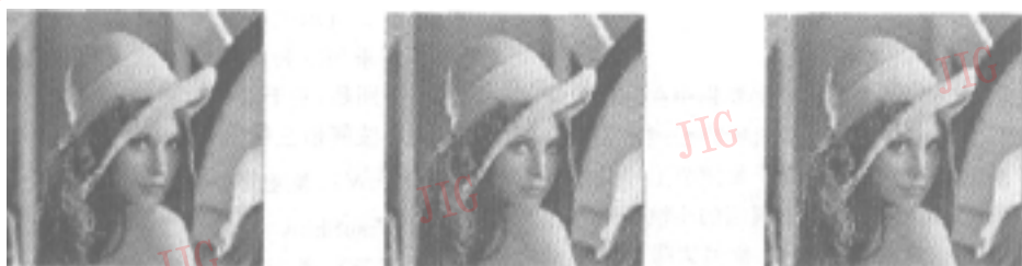
(a) 基于边缘检测的小波阈值去噪方法 (采用 VisuShrink 阈值) (b) 普通的小波阈值去噪方法 (采用 VisuShrink 阈值) (c) 普通的小波阈值去噪方法 (采用经过调整的 VisuShrink 阈值)