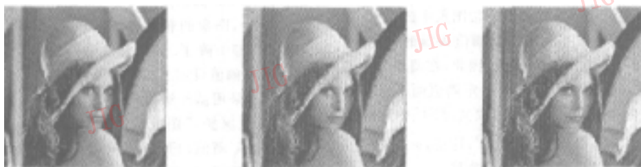
(a) 基于边缘检测的小波阈值去噪方法 (采用 VisuShrink 阈值) (b) 普通的小波阈值去噪方法 (采用 VisuShrink 阈值) (c) 普通的小波阈值去噪方法 (采用经过调整的 VisuShrink 阈值)